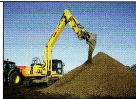
Zuverlässige Baumaschinen aus dem HKL Mietpark

Ein neuer Trainingsort für Tornesch: Seit Herbst 2013 wird hier an einer modernen Sportanlage für die süd-schleswig-holsteinischen Kleinstadt gearbeitet. Die Firma Hans-Joachim Weitzel GmbH & Co. KG setzt dabei auf die flexiblen Baumaschinen von HKL. Auf der 66.000 Quadratmeter großen Bearbeitungsfläche entstehen unter anderem zwei Kunstrasenspielfelder, ein Naturrasenfußballspielfeld, ein Soccercourt und eine 3-Feld Soccer-Sporthalle mit Funktionstrakt.