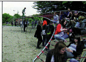
Hingucker mit Spaßgarantie

Für kleine und große Sternengucker: Gestaltung und Spielwert sind bei diesem Spielgerät sehr gut miteinander in Einklang gebracht. Der Kometenschweif mit seinem ansprechenden Design wird zum „Hingucker“. Er eignet sich für Kinder ab circa fünf Jahren – nach oben sind natürlich