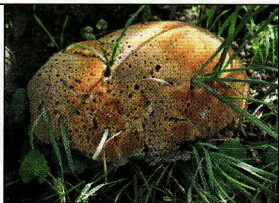
Holzzersetzende Pilze online

Auf der Messe werden die Neuheiten des Baumkatasterprogramms Arbokat® präsentiert. Dazu gehören der äußerst robuste Tablet Algiz 10X sowie der nur 180 Gramm schwere Handheldrechner Nautiz X. Neu ist die Anbindung der Arbokat-Daten an das GIS IngradaWeb. Arbus hat sein Buch „Holzzersetzende Pilze“ ins Internet als Web-App gebracht. Damit fällt es leichter als je zuvor, holzzersetzende Pilze vor allem mit Hilfe von Vergleichsfotos zu bestimmen. Eine Unterstützung bieten Filter zur Baumart und zum Befallsort. Damit bleiben meist nur wenige Pilzarten übrig. Kostenlosen Testzugang: www.baumpilze.info .