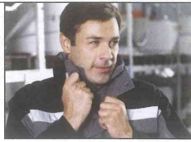
Jacke mit einer Membran von Gore-TEX®

DBL – Deutsche Berufskleider-Leasing GmbH, Albert-Einstein-Straße 30, 90513 Zirndorf, Telefon 0911 965858-0, info@dbl.de, www.dbl.de