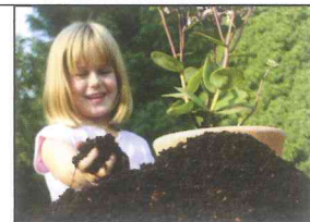
Baustellen brauchen Hauke Erden

Hauke Erden GmbH, Kehlenweg 5, 71686 Remseck, Telefon 07146 8944-0, Fax 07146 8944-20, info@hauke-erden.de, www.hauke-erden.de