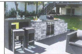
Outdoorküchen von EHL

EHL AG, Bundesstraße 127, 56642 Kruft bei Andernach, Telefon 02652 8008-0, Fax 02652 8008-88, info@ehl-net.de, www.ehl.de